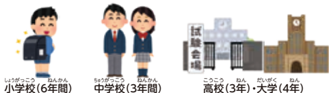
しょうがっこう ねんかん 小学校(6年間)

さい さい こども こくせき かんけい こうりつ しょうがっこう ちゅうがっ 6歳から15歳の子供は、国籍に関係なく公立の小学校・中学 こう つうがく にょうがく す ししょうせん そうだん 校に通学できます。入学については住んでいる市町村に相談し ましよう。高校と大学は、入るときに試験があります。